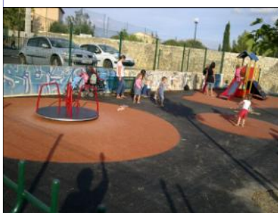
aire de jeux d'enfants de 1 à 6 ans.

accès piétonnier sécurisé du chemin des écoles aux jeux pour enfants (ouvert toute l'année), au plateau sportif et à l'école.