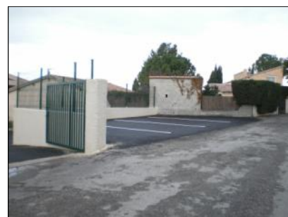
arrêt minute sur le chemin des écoles